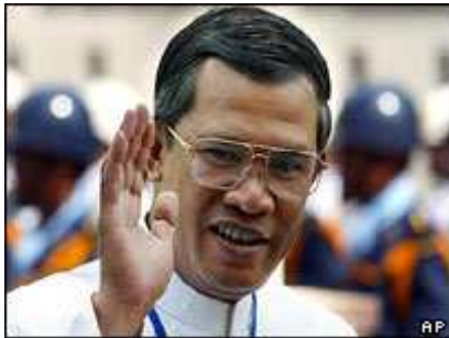
Prime Minister Hun Sen

Cambodia's veteran leader Hun Sen was re-elected by parliament in July 2004 after nearly a year of political stalemate.